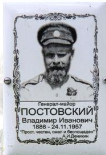
Генерал добровольческой армии Денкинна бывший казачий офицер

На территории Воскресенского некрополя захоронено порядка тысячи участников гражданской войны. Многие участники принимали участие в событиях 1917-1922 гг.