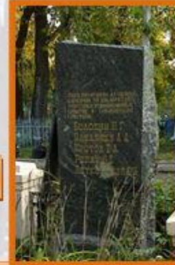
Братская могила, революционеров из партии эсеров, казненные 30/XII- 1907 г. царским