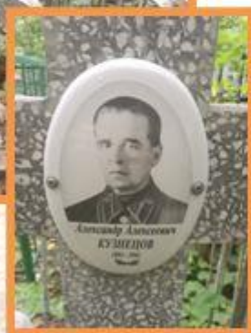
Могила Кузнецова А.А. участника гражданской войны, телеграфиста советского военачальника, участника Гражданской войны Гай Гая Дмитриевича