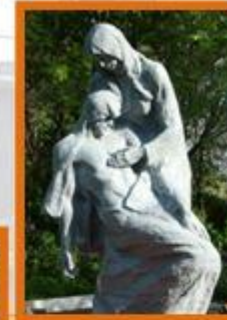
Братское захоронение воинов Великой Отечественной войны умерших от ранений в