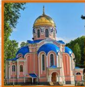
Церковь Воскресенья (православный храм)