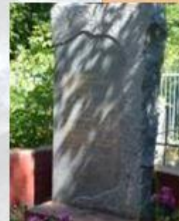
Братская могила активных участников установления Советской власти