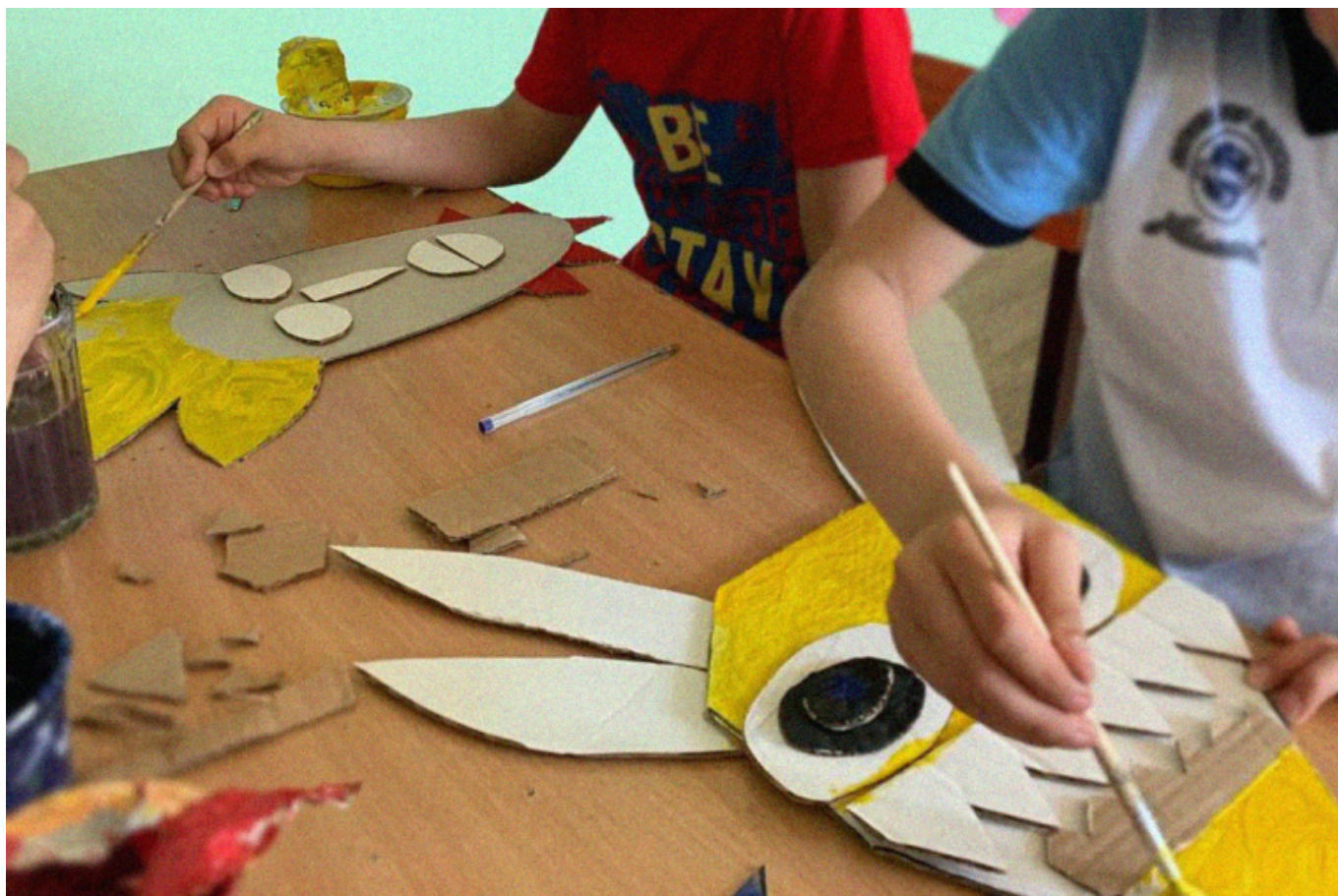
Ученики начальной школы.

Но постоянно так делать не получалось. Школа — самое простое пространство для агитации. Скажешь детям выстроиться в букву Z, и они выстроятся.