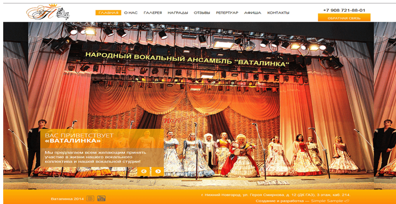
Сайт ансамбля «Ваталинка».

Хотя, конечно, в каких-то моментах ей помогают ребята, которые с ней работают. Сайт получился достаточно молодежный, современный, там большие фотографии, слайдеры. Если честно, ни у одного нашего НКО мы такого сайта не видели.