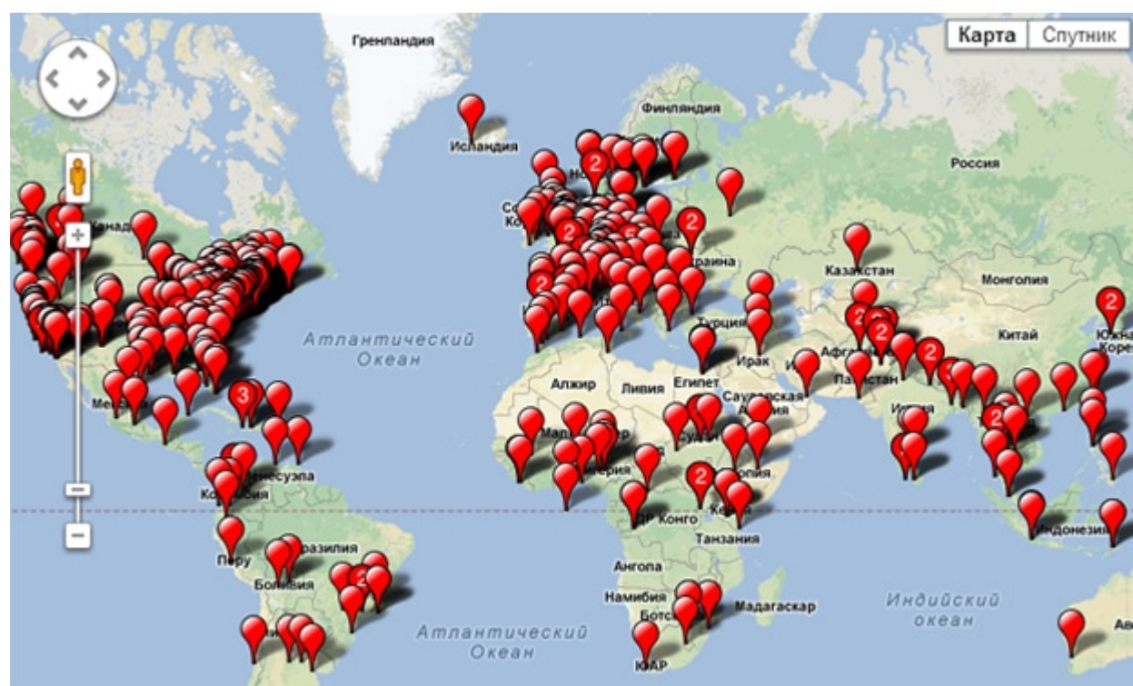
Карта участников Crisis Mapping

Для немедленной связи с сообществом пишите: crisismappers@googlegroups.com